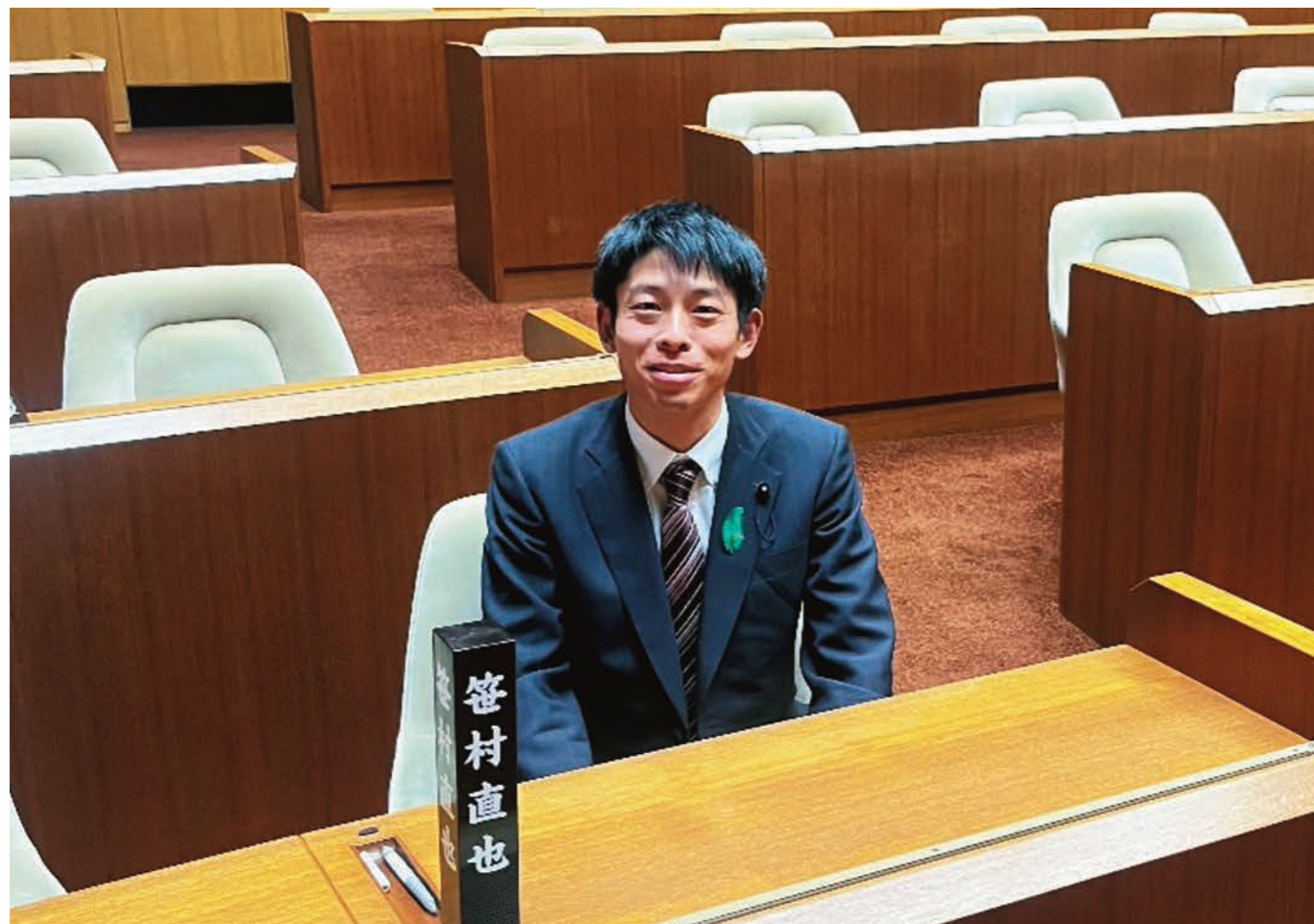
5月8日、初登庁の本会議場にて

平素よりお世話になっております。先に行われた、山口県議会議員選挙において初当選させていただきました。皆様から寄せられたご意見を政策に反映させ、少しでも地域を前に進めていくことができ、萩・阿武地区はもちろん県全体の発展のために仕事をしてまいります。引き続きのご支援、ご指導をよろしくお願いたします。