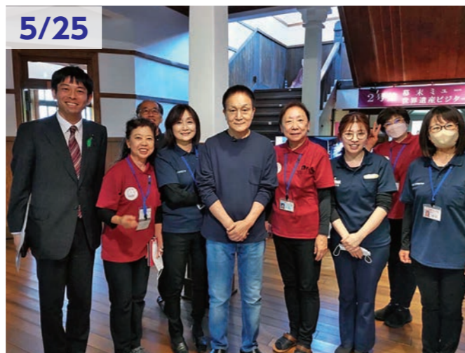
5/25 萩・明倫学舎で、歌手の小田和正さんと