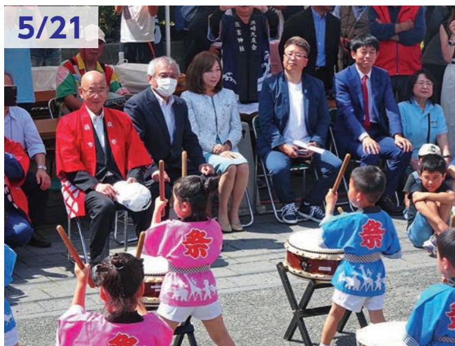
5/21 浜崎おたから博物館