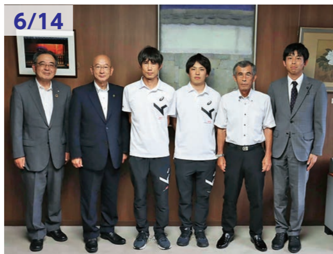
6/14 合宿で来萩の安川電機陸上部と萩市長を訪問