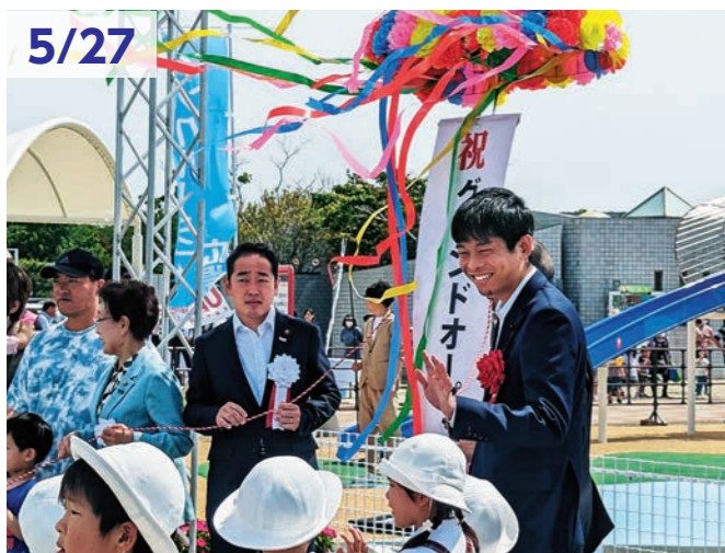
5/27 山口宇部空港横に完成した遊具の完成記念式典