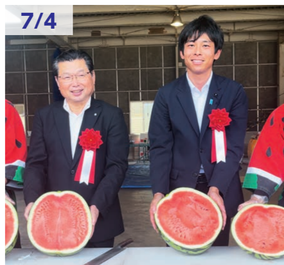
7/4 福賀すいか出発式